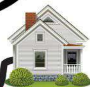
Rumah Rehat Sri Pertahanan